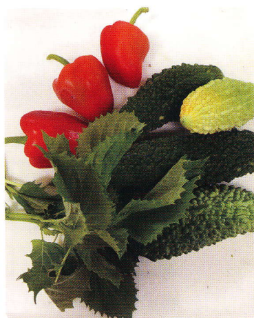
自家製無農薬野菜