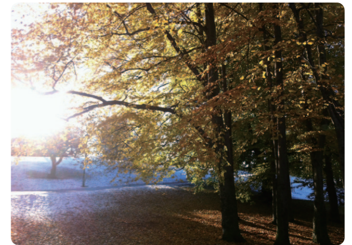
「ノルウェーの秋」お客様からのお便り