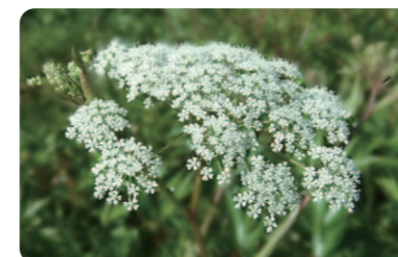
無農薬薬草「当帰の花」