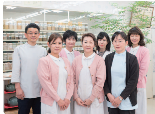
静岡店スタッフ一同

の健康とは心と身体が調和し常に自然体であること」と書きました。なんとなくその意味はご理解頂けると思いますが、「常に自然体」になることは難しいものです。そこでそのヒントを歴史上の人物に伺ってみました。