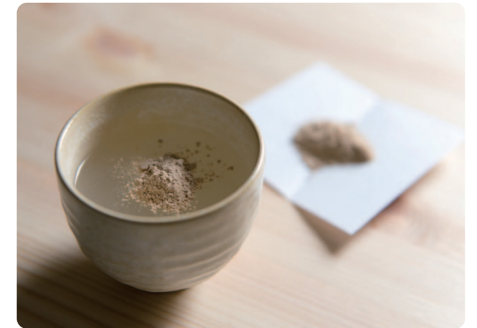
かぜに自家製漢方風邪薬

顔には 14 経絡のうち 8 つの経絡が通っているので、顔だけでなく体も楽になります。この記事のことを考えていたら、蒸しタオルのあとに化粧水をつけるという CM が流れました。蒸しタオルは美容にもいいですね。