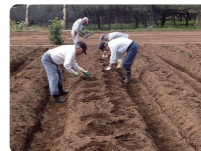
薬草畑・やちよ村